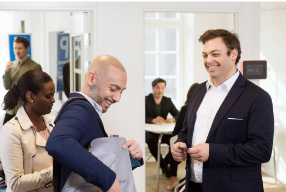
En del av Göteborgs Stad